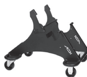
SE-20 A : 22" C : 24"