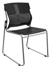
SE-2 A : 18" C : 18" E : 14"