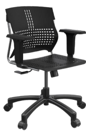
SE-L A : 18" C : 16" - 21" E : 14"