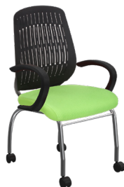
WE-H-4 A : 20" C : 18" E : 22"