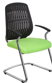
WE-H-6 A : 20" C : 18" E : 22"