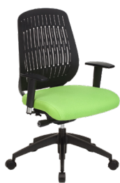
WE-H A : 20" C : 17" - 22" E : 22"