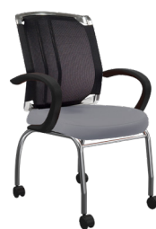
VO-L-4 A : 20" C : 18" E : 22"