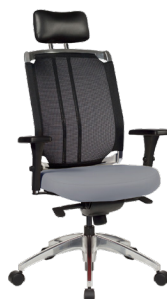
VO-E A : 20" C : 17"- 22" E : 32"