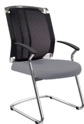
VO-L-6 A : 20" C : 18" E : 22"