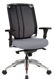
VO-H A : 20" C : 17"- 22" E : 24"