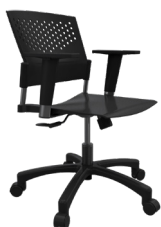
PN-L A : 17" C : 17"- 22" E : 13"