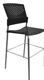
PN-8 A : 17" C : 30" E : 13"