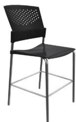
PN-7 A : 17" C : 24" E : 13"