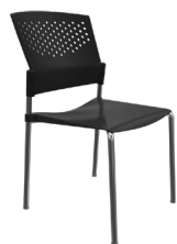
PN-4 A : 17" C : 18" E : 13"