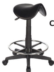
HS A : 16" C : 18" - 23"