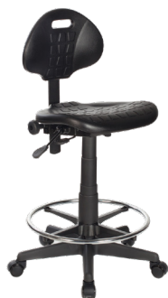
LB-L A : 18" C : 18" - 23" E : 12"