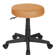
TB-O A : 15 1 / 2 " C : 18" - 23"