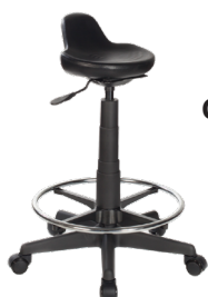
SD A : 13" C : 18" - 23"