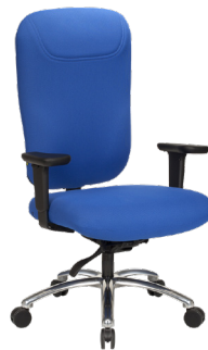
EV-D A : 24" C : 20" - 25" E : 29"