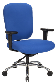
EV-H A : 24" C : 20" - 25" E : 22"