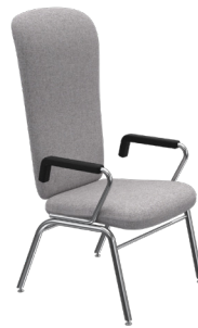
EC-E-4P A : 19 1/4 " C : 18" E : 28"