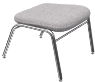
EC-O-4 A : 23 3/4 " C : 17 3/4 "