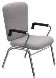
EC-H-4 A : 19 1/4 " C : 18" E : 20"