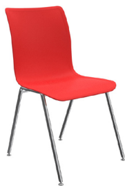
CO4A A : 17 3/4 " C : 18" E : 16 3/4 "