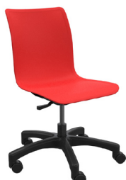
COBE A : 17 3/4 " C : 15 3/4 " - 21" E : 16 3/4 "