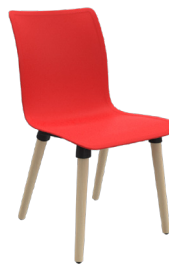
CO4B A : 17 3/4 " C : 18" E : 16 3/4 "