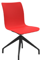
COBP A : 17 3/4 " C : 17 1/2 " E : 16 3/4 "