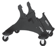
CL-20 A : 22" C : 24"