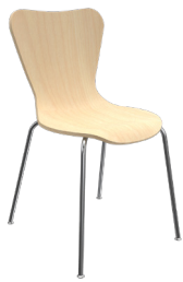
CL-4 A : 18" C : 18" E : 17"