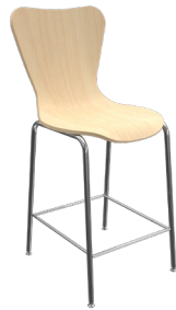
CL-7 A : 18" C : 24" E : 17"