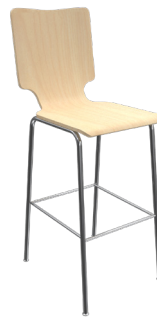
CM-8 A : 16" C : 30" E : 17"