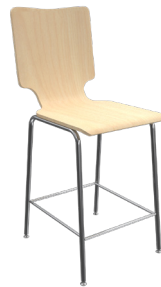
CM-7 A : 16" C : 24" E : 17"