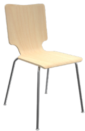
CM-4 A : 16" C : 18" E : 17"