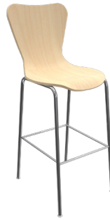
CL-8 A : 18" C : 30" E : 17"